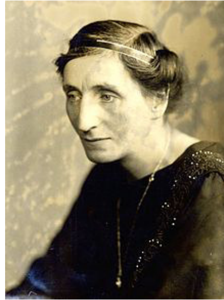
Fotografie von Alice Salomon, 1900